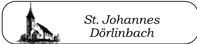
St. Johannes Dörlinbach

Um 10.30 Uhr findet in Dörlinbach ein kindgerechter Kreuzweg statt. Wir wollen gemeinsam die Stationen des Kreuzwegs betrachten. Eingeladen sind alle Erstkommunionkinder und Kinder aus der Seelsorgeeinheit.