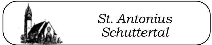
St. Antonius Schuttertal

Bankverbindung für das Spendenkonto für das Pfarrzentrum: Sparkasse Kto.-Nr. 4837483, BLZ 664 500 50. Für Ihre Unterstützung jetzt schon ein herzliches Vergelt's Gott.